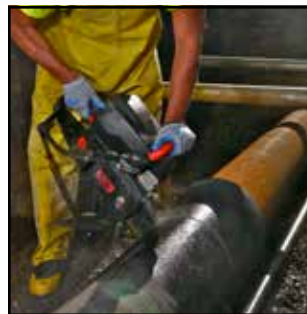
Plus sûre pour le découpage de la fonte ductile