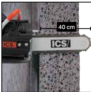
Outil de découpage en profondeur dans des ouvertures obstruées ou petites